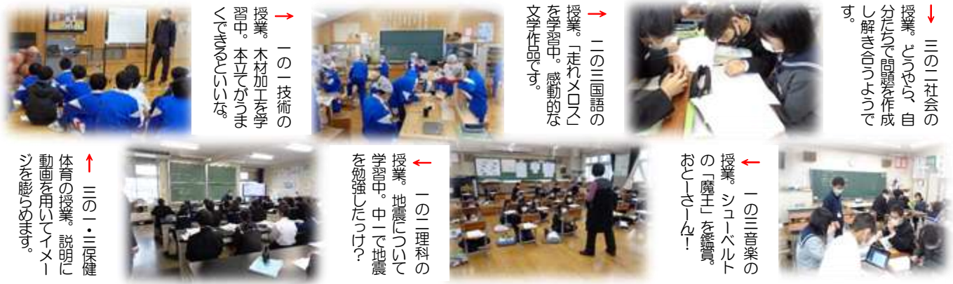
↓ 三の二社会の授業。とじゆら、自分たちで問題を作成し解き合うようです。