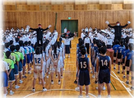
壮行会にて全校の応援を受ける選手たち