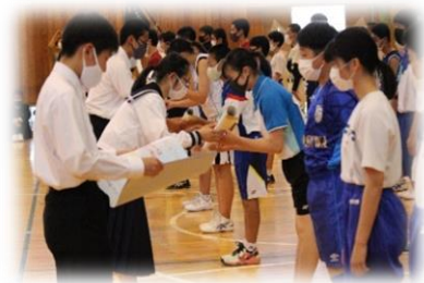
応援メッセージが選手たちに贈られます