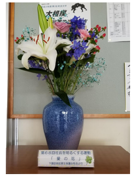
「愛の花」 厚生保護女性会より